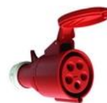
5-polige krachtstroom contrastekker